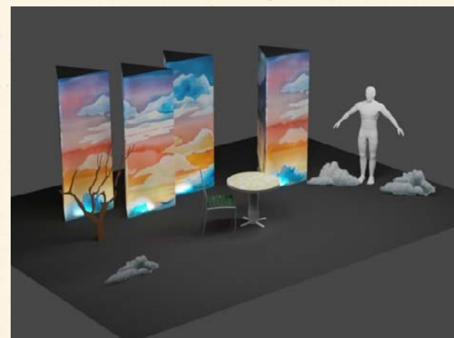
Figurins de Nídia Tusal i maquetes de l'escenografia de La Closca